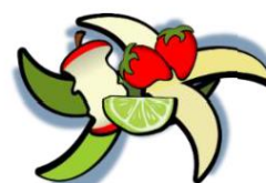
non abbandonare rifiuti