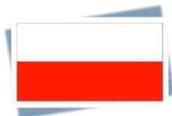
segui il sentiero