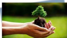
rispetta la bellezza della natura