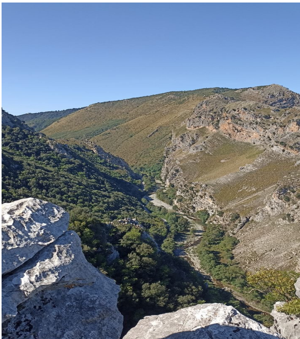
Valle del Mingardo con dorsale del monte Chiancone

SEZIONE DI NAPOLI Fondata nel 1871 www.cainapoli.it tel. 081.417633