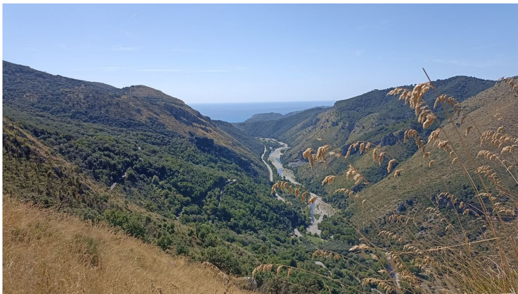
Valle del Mingardo con panorama che giunge fino al mare ed alla collina della Molpa

SEZIONE DI NAPOLI Fondata nel 1871 www.cainapoli.it tel. 081.417633