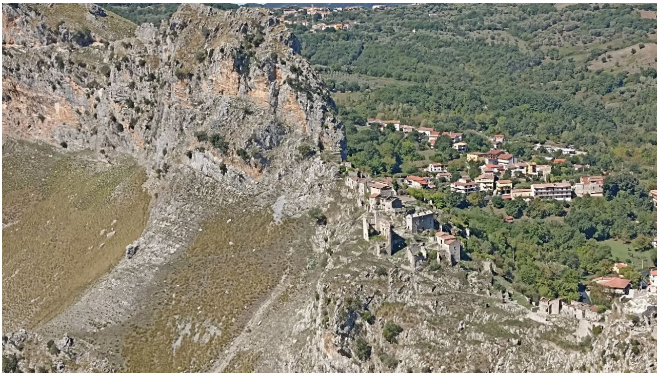
Borgo abbandonato di San Severino

SEZIONE DI NAPOLI Fondata nel 1871 www.cainapoli.it tel. 081.417633