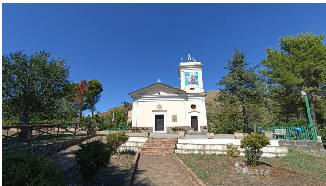
Santuario della SS. Annunziata