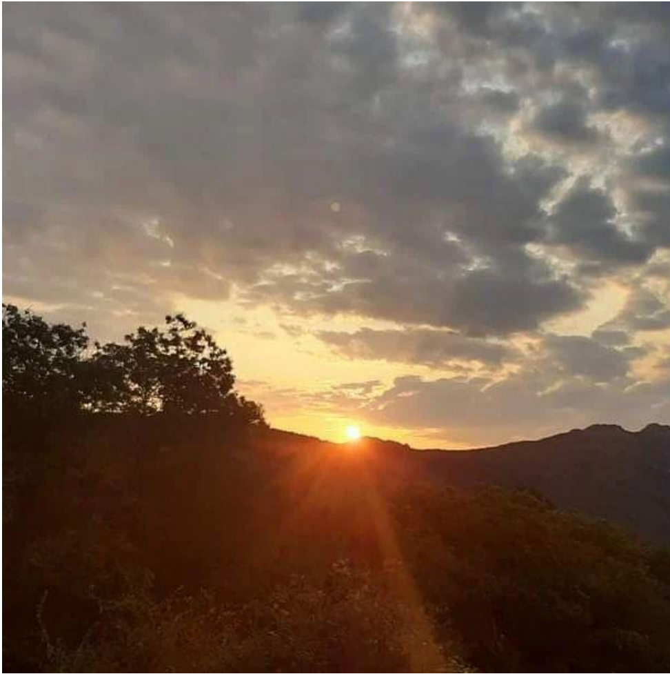
Alba vista dal punto panoramico sentiero che porta a Fossa delle Nevi.