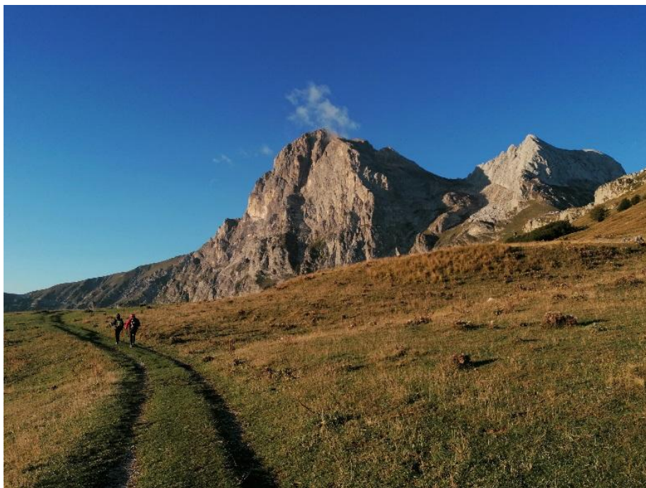
Figura 1 Vista dei due Corni da Cima Alta