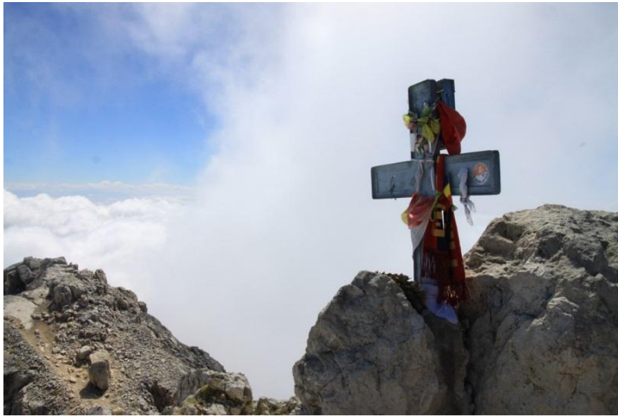
Figura 5 vetta occidentale del Corno Grande