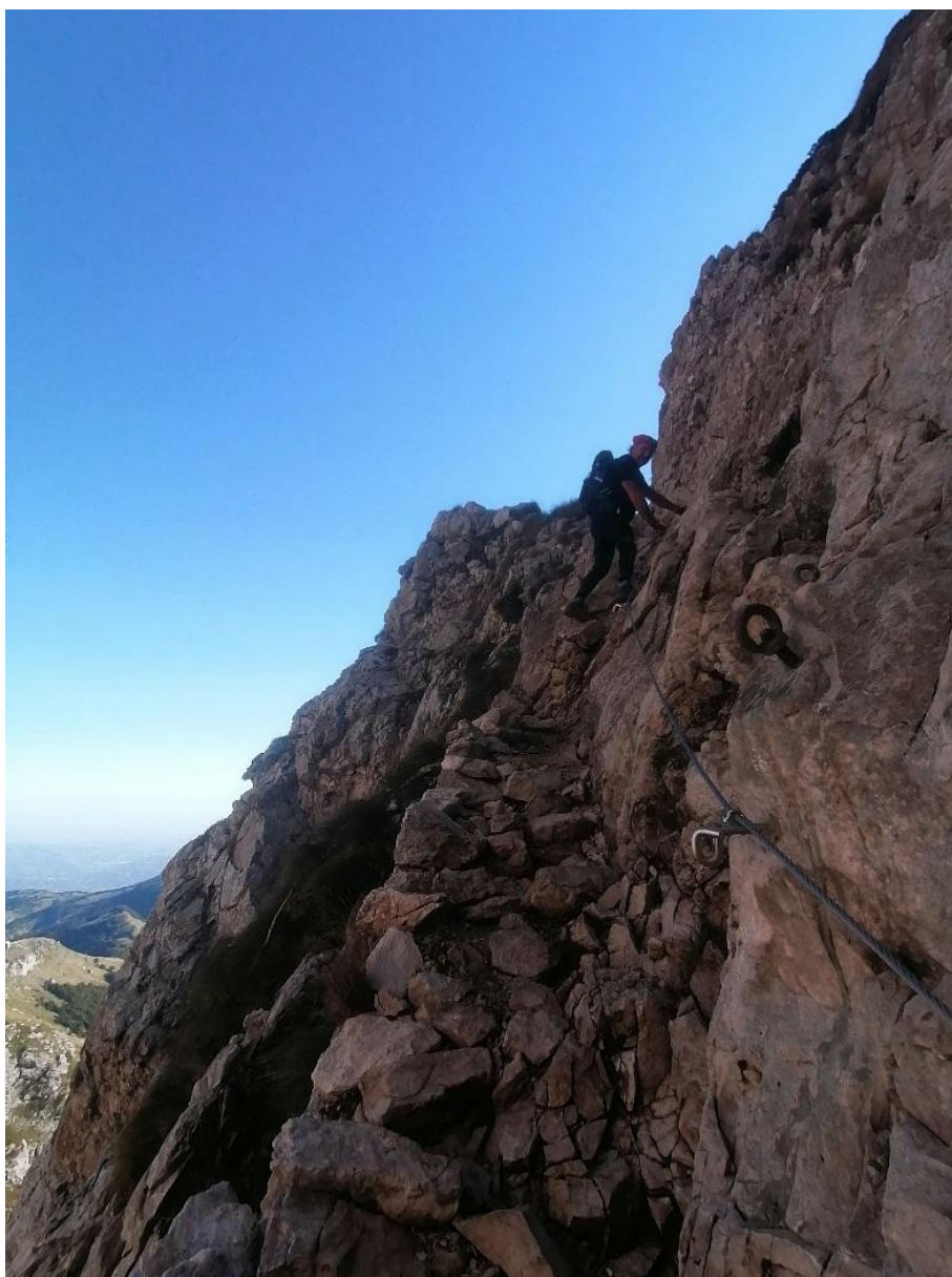
Figura 2 Breve tratto attrezzato