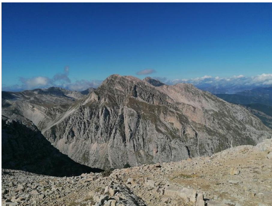
Figura 4 vista dell'Intermedesoli dalla Sella dei Due Corni