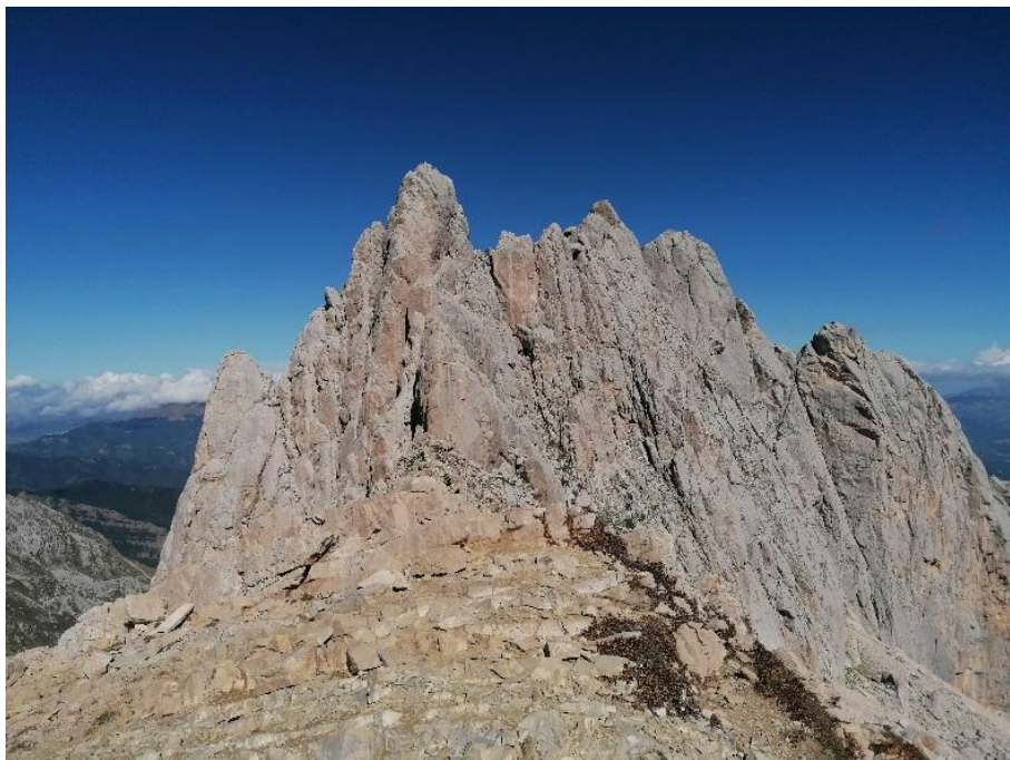
Figura 3 Il Corno Piccolo e le sue Fiamme di Pietra.