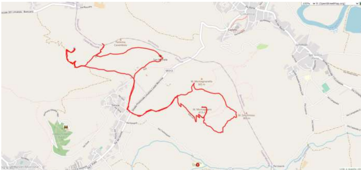
Sentiero Dell'Amore – Collina di Montagnano