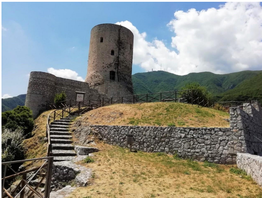
La Torre di Summonte