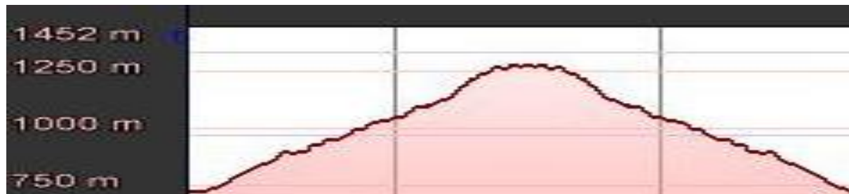
Altimetria del percorso