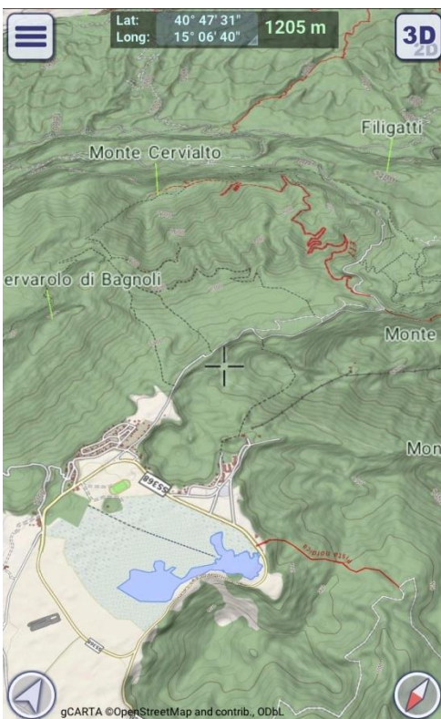
La strada che porta dal lago Laceno al valico Colle del Leone