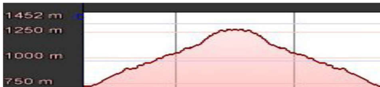
Altimetria del percorso